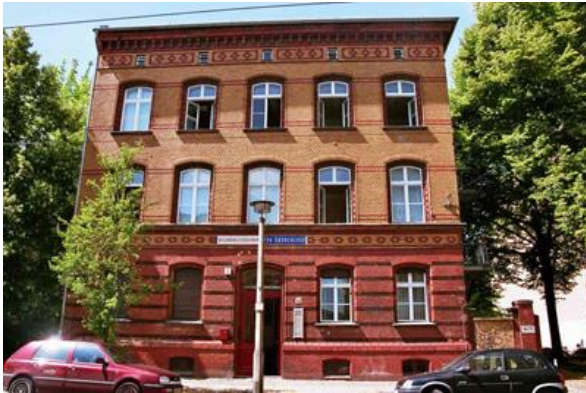
Das Gesundheitszentrum in Berlin-Mitte

In Berlin leben mehrere Tausend Menschen auf der Straße. Eine niedrigschwellige Versorgung ohne Ansehen der Person und der Umstände ist für diese Menschen dringend notwendig.